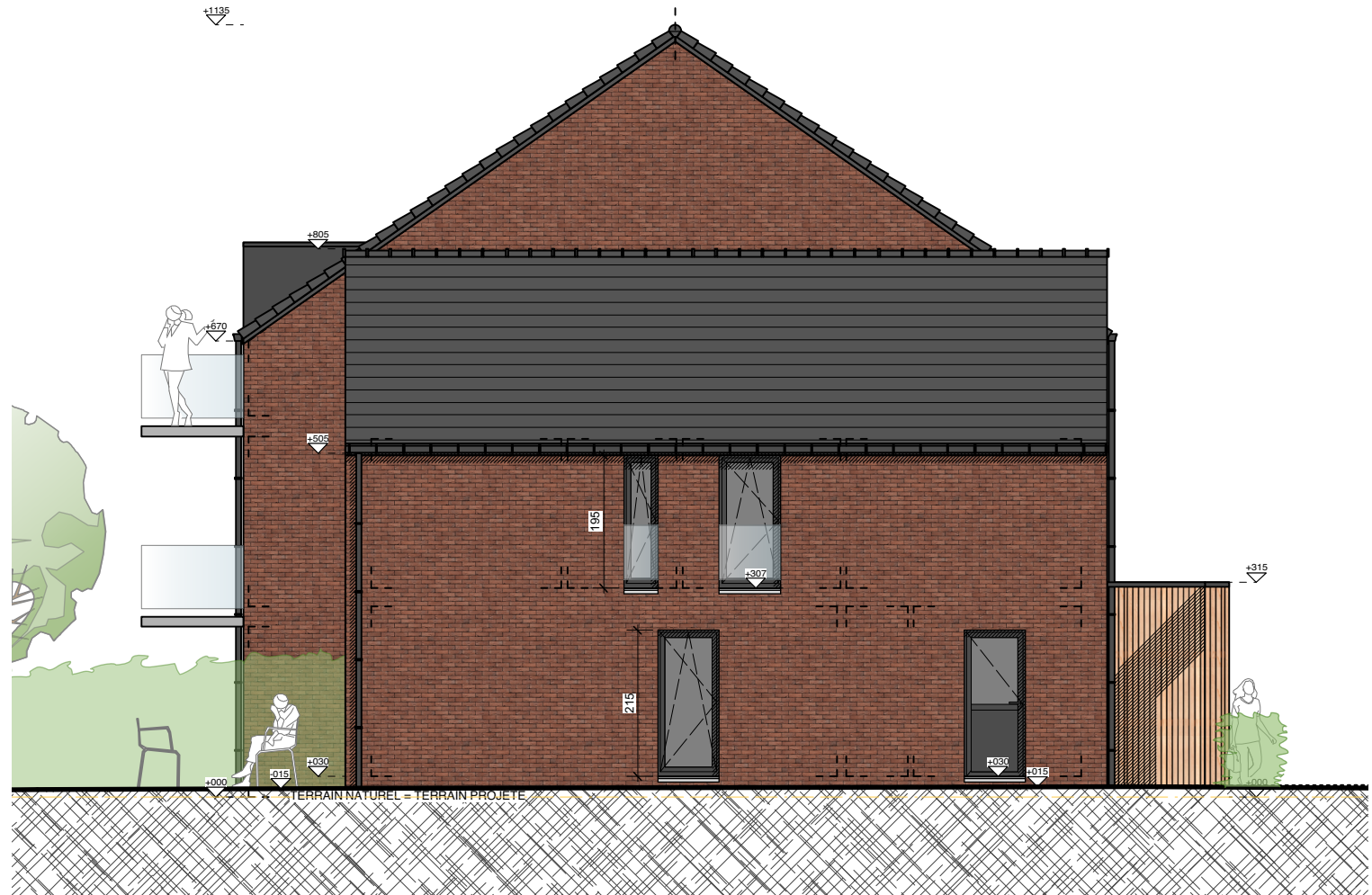
ELEVATION LATÉRALE GAUCHE - MAISON 1