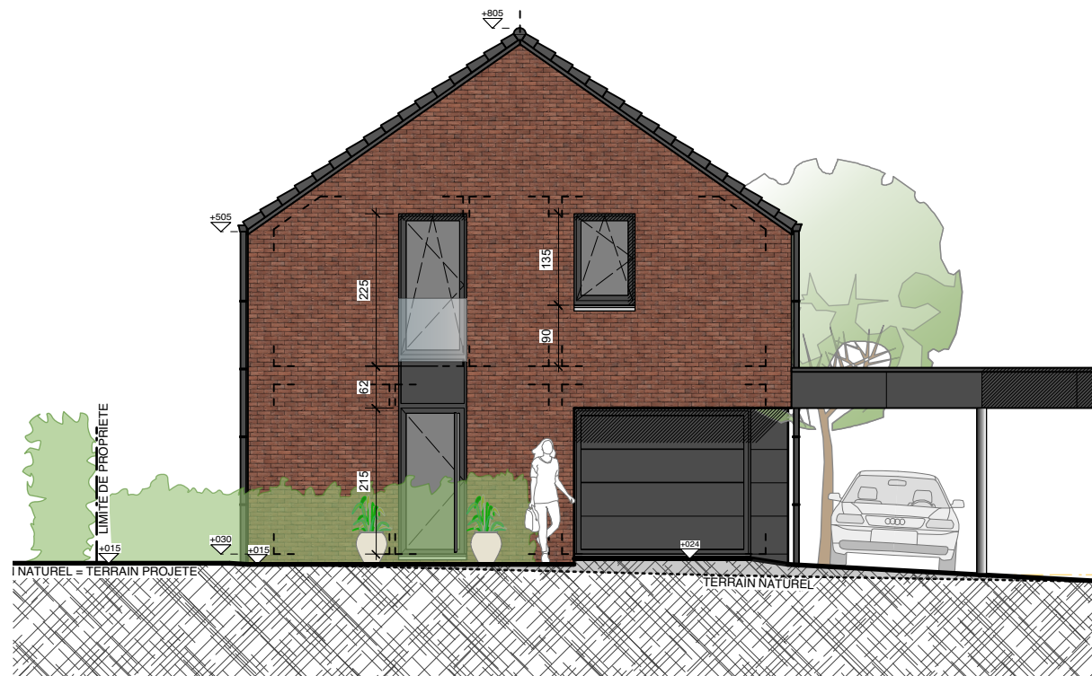
ELEVATION A RUE - MAISON 1