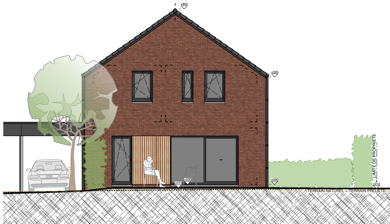
ELEVATION ARRIÈRE - MAISON 1